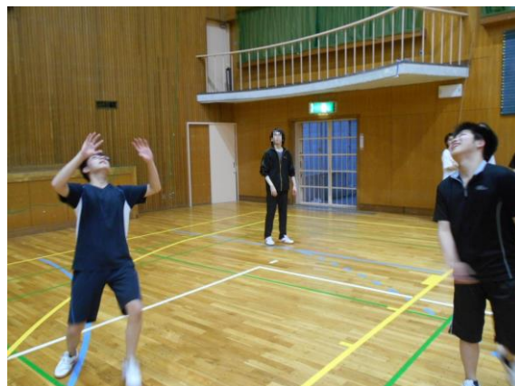
球技大会の一コマ