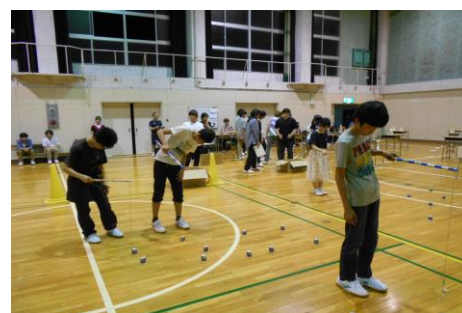
新入生歓迎レクリエーション大会