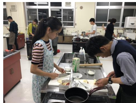
授業風景（調理実習）