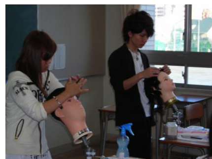
進路行事での体験学習