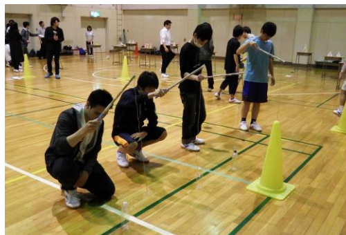
新入生歓迎レクリエーション大会