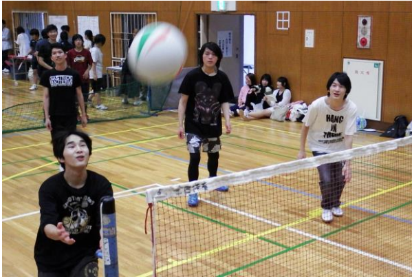
球技大会の一コマ